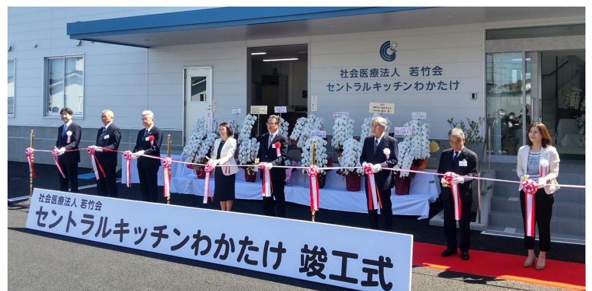
テープカットの様子